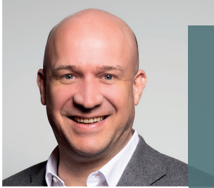
Ingmar Jung, Hessischer Minister für Landwirtschaft und Umwelt, Weinbau, Forsten, Jagd und Heimat