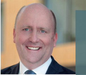
Uwe Becker, Staatssekretär, Hessisches Ministerium der Finanzen