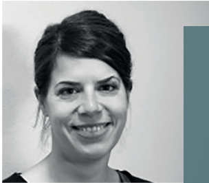
Stephanie Bergbauer, Lead Market Infrastructure Expert der EZB